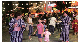
■毎年8月下旬(木~土) ■北与野駅南口イベント広場