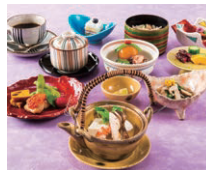
日本料理「秋ヶ瀬庵」