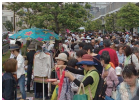
■毎年4月29日(祝・昭和の日) ■北与野駅西側時の道