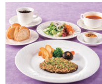
洋風料理「サルデーテ」